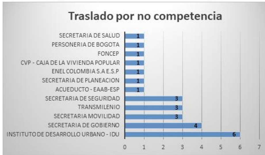
Gráfica No.2 Traslado por no competencia

De igual manera, en esta sección se incluyen peticiones que fueron trasladadas en periodos anteriores.