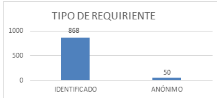
Gráfica No. 3 tipo de requirente