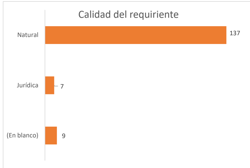
Gráfica No. 4 calidad del requirente

La calidad del requirente continúa siendo la persona natural, con un mayor registro de 137 personas, que corresponde al 88.54%; seguido por las personas jurídicas siete (7), que corresponden al 4,58%; y en blanco nueve (9), que corresponden al 4.58 %. En esta oportunidad no reportaron establecimiento.