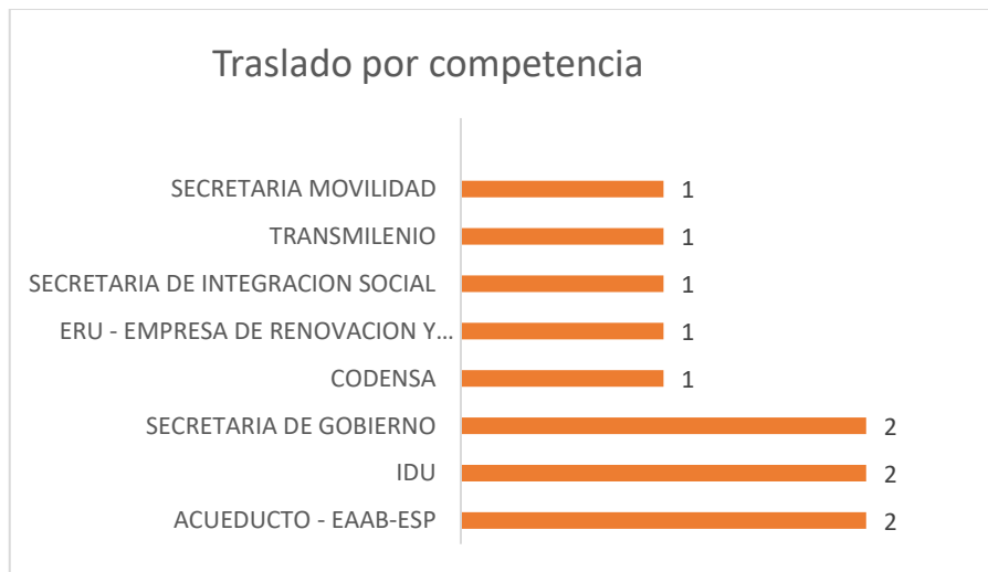
Gráfica No.2 Traslado por competencia