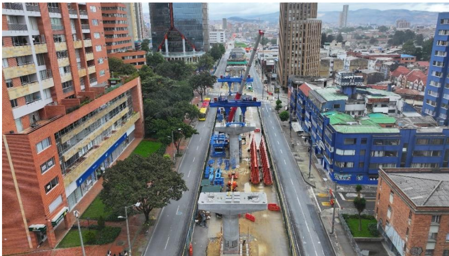
Construcción del viaducto

En la última fase, la maquinaria necesaria para la cimentación y construcción de las columnas, capiteles y posterior izaje de las vigas U llegará a la zona para dar vida al viaducto de la Línea 1 del Metro de Bogotá. Posterior a esto, se podrá ubicar la nueva estación de TransMilenio Tercer Milenio.