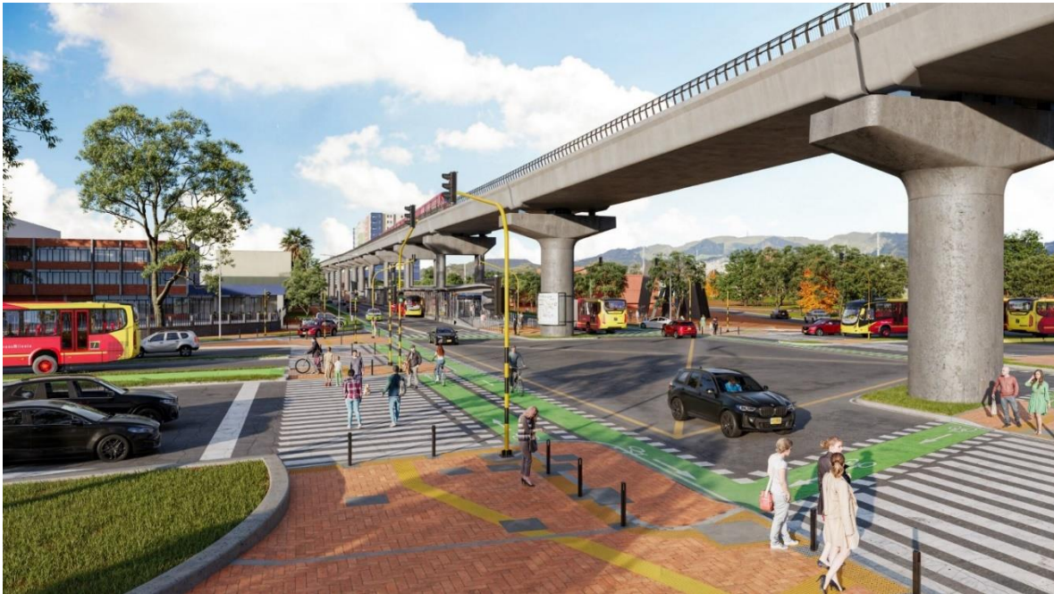
Viaducto y nueva estación Tercer Milenio en el centro de la ciudad