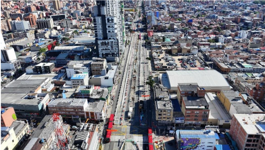
Salida de los buses de TransMilenio al carril mixto e interno.