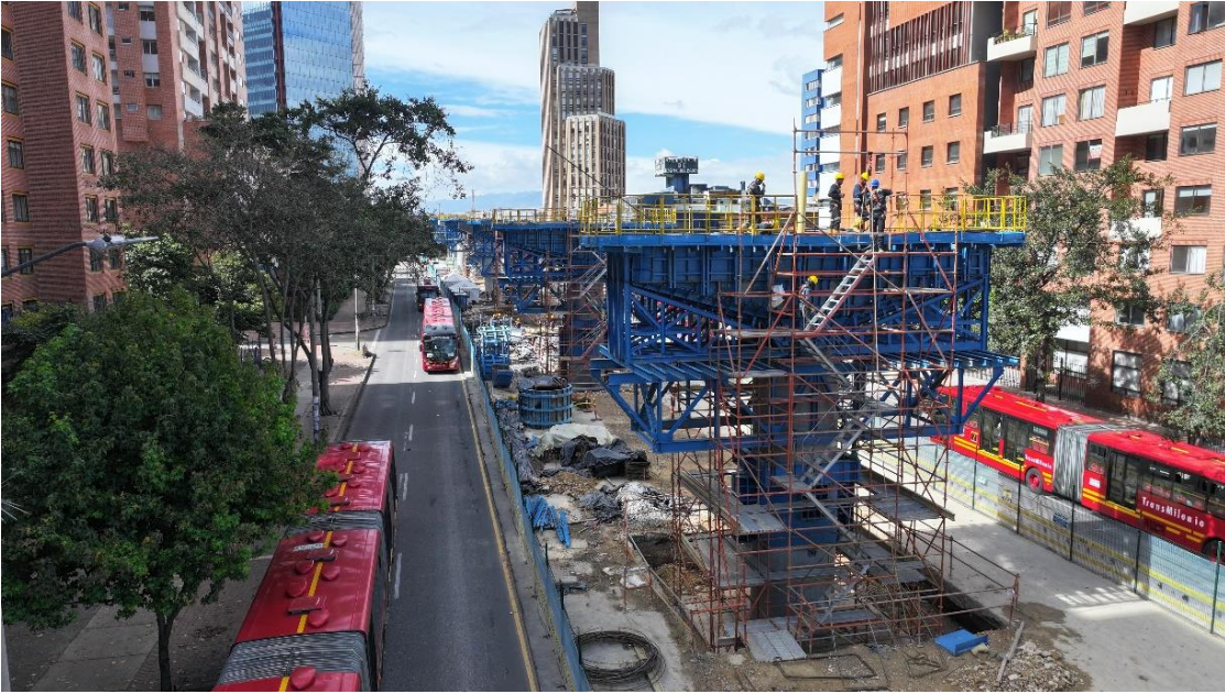
Ejemplo de la construcción del viaducto sobre la av. Caracas.

Los ciudadanos que quieran conocer más sobre las obras en este punto de la ciudad pueden contactarse a través del correo electrónico socialtramo5@metro1.com.co o visitar la oficina de atención al ciudadano ubicada en la carrera 13A No. 38-90.