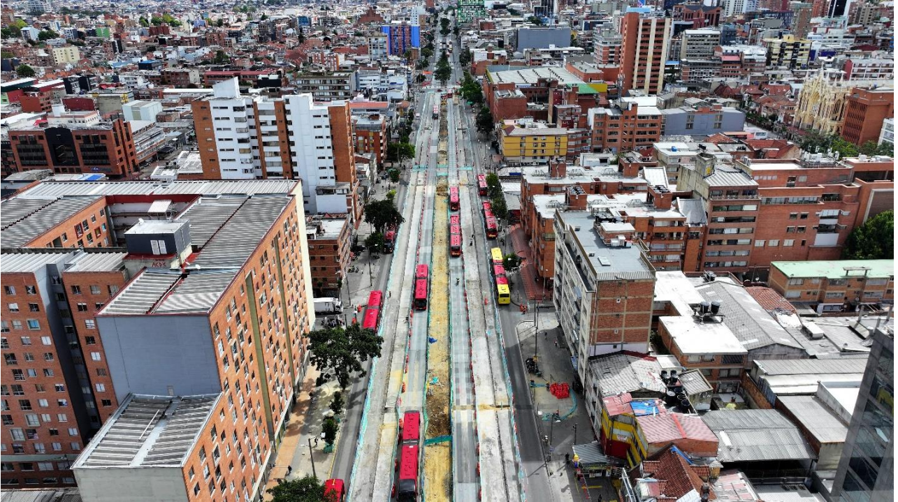
Ejemplo de la salida de los buses de TransMilenio al carril mixto.

mixto con el del TransMilenio, para alcanzar el ancho necesario para el tránsito de los buses; además de adecuar el separador para los trabajos del viaducto. En esta segunda fase el tráfico mixto no circulará por la av. Caracas entre calles 13 y 19 y la SDM, TMSA y la EMB presentarán con la debida anticipación el plan de manejo de tráfico para los vehículos mixtos.