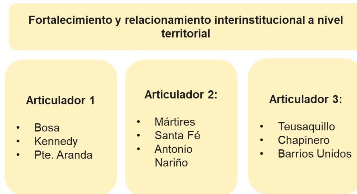
Ilustración 4: Estructura gestores territoriales. Fuente EMB. 2022.

Para el desarrollo de las acciones territoriales descritas en el presente documento, fue necesario conformar un equipo de profesionales que se encuentran permanentemente en territorio. Este equipo se encuentra conformado de la siguiente manera: