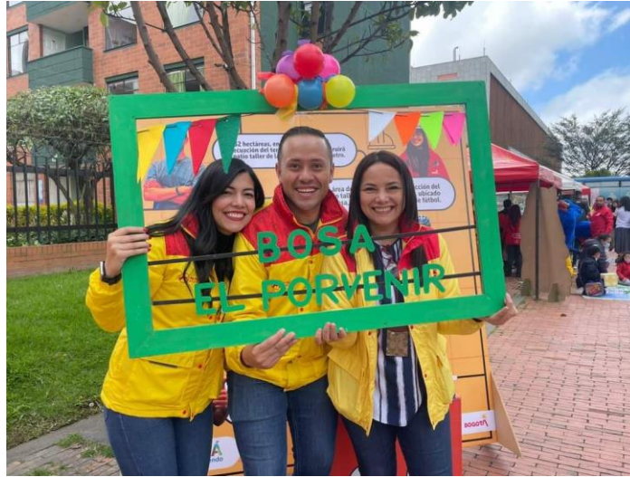
Ilustración 7: Gestión social.

De igual manera, se han adelantado procesos de relacionamiento interinstitucional, con el fin de afianzar las relaciones con diferentes entidades de orden distrital y nacional, además de adoptar las políticas públicas que apuntan a generar condiciones de inclusión social en el sistema Metro.