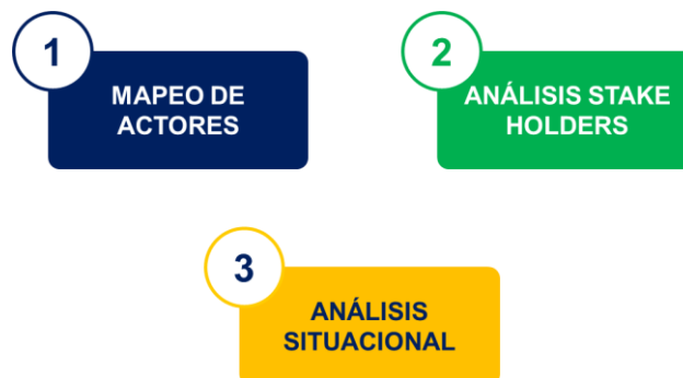
Ilustración 5: Estructura gestores territoriales. Fuente EMB. 2022.

Para el desarrollo de las actividades territoriales, se realiza un ejercicio permanente a través de los siguientes insumos: