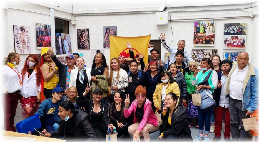
Ilustración 1: Encuentro Ciudadano – Sector LGTBI que realiza actividades sexuales pagadas.

Con el objetivo de fomentar la transparencia en los procesos y mantener informada a la ciudadanía, se actualizó la sección de gestión social de la página web del metro de Bogotá, incluyendo de manera permanente los informes de participación generados y las agendas con las actividades de gestión social a desarrollar; así mismo fue publicado oportunamente el Plan de Participación Ciudadana y el reporte propuesto para la vigencia 2023, documentos que pueden ser consultados en el siguiente link: