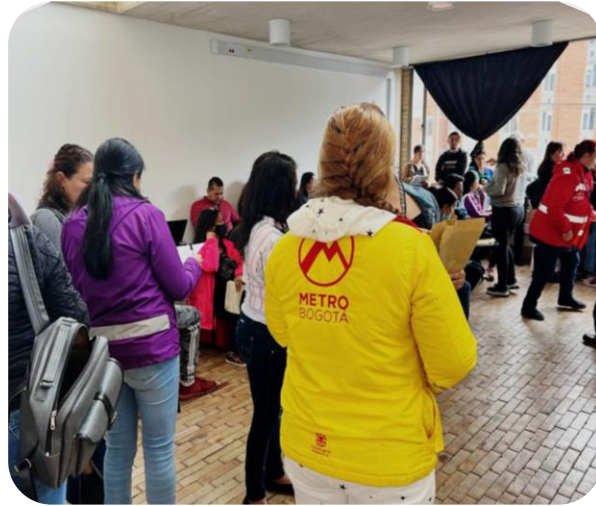
Ilustración 3: Gestión territorial EMB.

Para el Desarrollo de la estrategia, se plantean cuatro enfoques, los cuales se entenderán como la perspectiva desde la cual deben ser observadas y atendidas las problemáticas de seguridad, convivencia y justicia en la implementación de acciones territoriales.